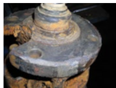
Daño por corrosión en campana