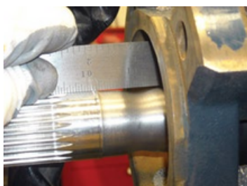
Eje del motor dañado por grava en la succión de la bomba No cubierto por garantía