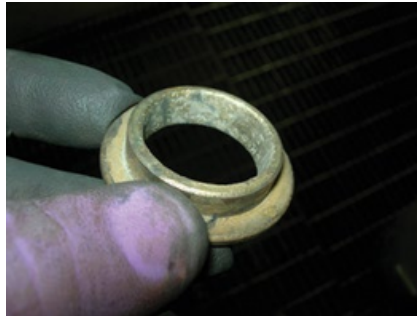
Desgaste en el DI del buje del eje No Visible