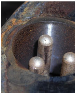
Corrosión y óxido en entrada del conector