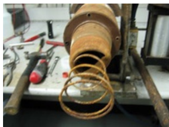
Óxido en el diafragma Bastante oxidado