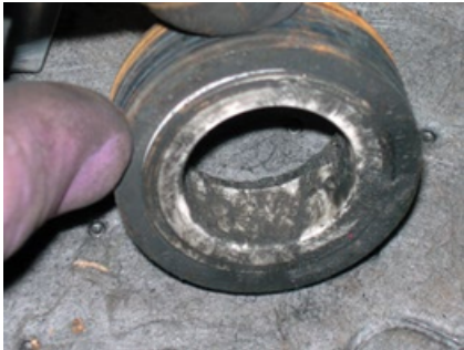
Sello cubierto con abrasivos/DI gastado No Visible