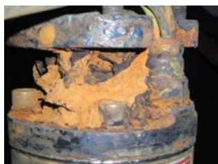
Daño por corrosión Consulte la página siguiente