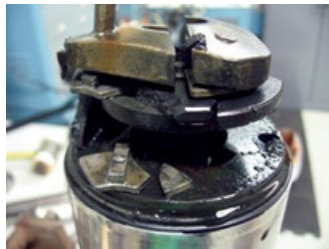
Se requiere un impacto muy fuerte para fracturar/partir los cojinetes