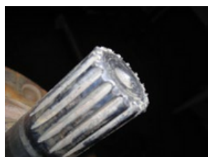
Extremo del eje con desgaste por abrasivos