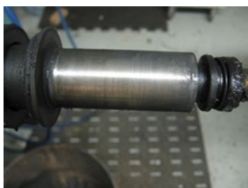
Residuos en cojinete Daño en el Eje