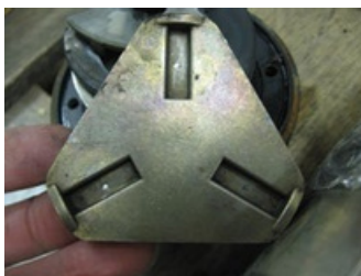
Hoyos debidos a un golpe de ariete