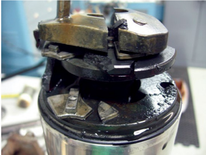
COJINTE DE EMPUJE, SOPORTE Y SEGMENTOS ROTOS