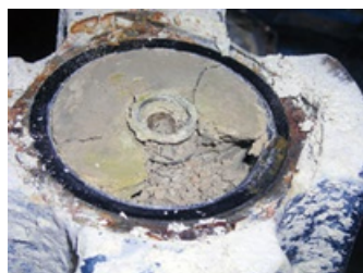
Ejemplo de la cavidad del diafragma en un motor enterrado