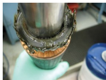
Empuje ascendente No cubierto por garantía