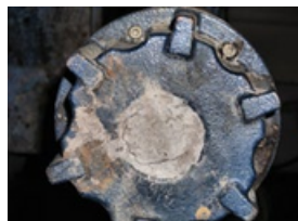
Enterrado en el fondo del pozo