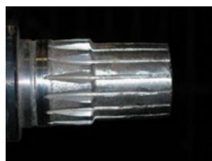
Desgaste en el estriado por abrasivos