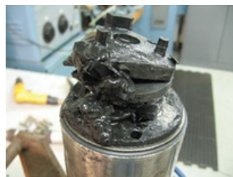
Enfriamiento inadecuado y carga de empuje por encima de la capacidad nominal

Estas fotos documentan ejemplos de daño por golpe de ariete sobre el sistema de cojinetes de empuje. Este daño es provocado por problemas en la válvula check, por ser rápida o por estar dañada. La carga asociada con el impacto por golpe de ariete es excesiva respecto a la carga de empuje nominal.