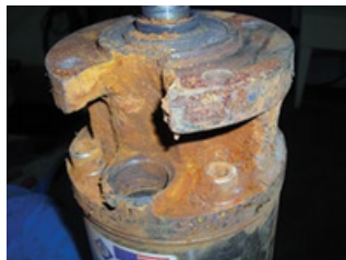
Sedimento - Sin conector instalado No cubierto por garantía