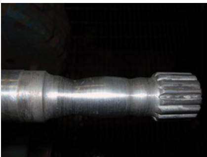
Eje con desgaste severo Visible