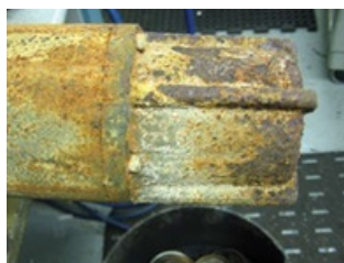
Corrosión/sarro No cubierto por garantía