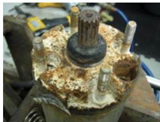
Corrosión - Sin conector No cubierto por garantía

Para calificar bajo garantía, se debe evaluar el motor con sus componentes originales instalados de fábrica. Esto incluye el ensamble del conector instalado de fábrica. El exceso de sedimento y/o corrosión puede indicar que el motor no recibió un flujo adecuado para enfriamiento y que el medio de bombeo puede ser agresivo. Revise como alternativa un motor de construcción en acero inoxidable 316 para mayor resistencia a la corrosión. Es necesario un análisis de la calidad del agua para determinar apropiadamente la construcción del motor.