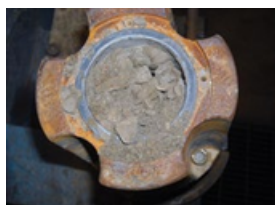
Cavidad del diafragma llena de lodo Del motor mostrado a la izquierda