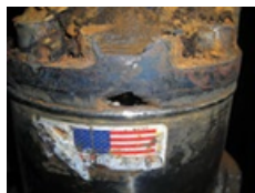
Corrosión en área de conector