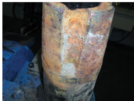
Arena encontrada en componentes

Todas las fotos son ejemplos de motores no cubiertos por garantía.