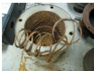
Agua agresiva/con arena o motor en arena.