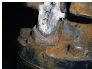
Corrosión excesiva No cubierto por garantía