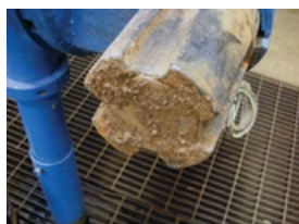
Enterrado en el fondo del pozo