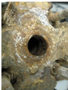
Exceso de corrosión/sarro

This example is a result of corrosion damage caused by an aggressive environment. Corrosion caused damage in the lead connection area, shown bottom right, which allowed water entry resulting in the motor grounding. This motor is not warrantable. The added corrosion resistance of the 316SS motor construction may be needed in the application.