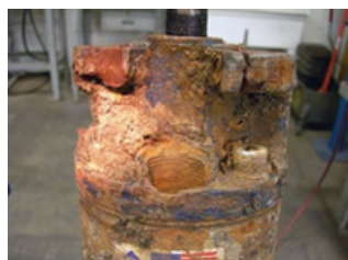
Sedimento - Sin conector instalado No cubierto por garantía