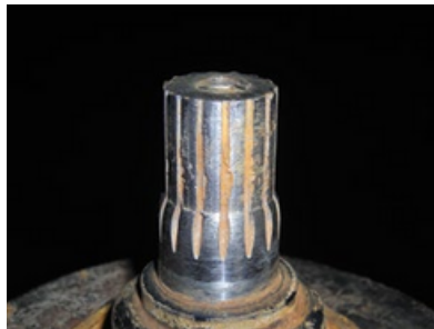
Orificio roscado en el eje

Todas las fotos son ejemplos de motores no cubiertos por garantía. Los daños en el estriado no se consideran defectos en el material o mano de obra, por lo tanto la garantía no los cubre. El estriado se puede dañar por instalación y/o acoplamiento de la bomba incorrectos. Cualquier alteración del eje o del estriado fuera de las especificaciones de fábrica de Franklin Electric anula la garantía.