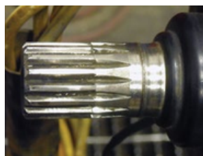
Desgaste por abrasivos en el eje