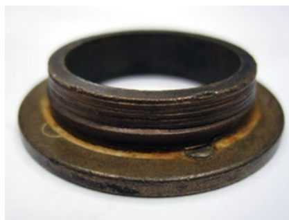
Casquillo del eje desgastado por arena Visible

Éste es un ejemplo de daño provocado por entrada de abrasivos. Los abrasivos dañan el sello del eje y el casquillo de latón de la cubierta del mismo, permitiendo el deterioro en los cojinetes y el estator incluyendo su liner (revestimiento). En la mayoría de los casos, la cubierta contra arena no estará fija en el eje. El motor puede mostrar movimiento lateral excesivo en el rotor.