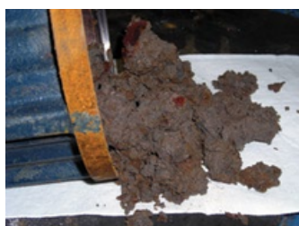
Cubierta de diafragma llena de lodo

Estas fotos documentan ejemplos de instalaciones que no tenían 10 pies de agua limpia entre la parte inferior del motor y el fondo del pozo. Esto provoca falta de flujo en las paredes de la carcasa del motor, creando una “zona caliente” y dañando los cojinetes en la mitad inferior del motor. La cavidad del diafragma puede revisarse a través del agujero en la placa/cubierta, o retirando la cubierta inferior.